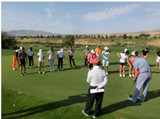
レッスン風景(パッティング)