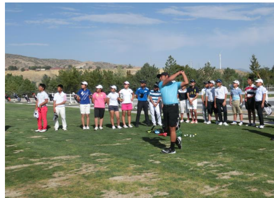
間近で見たPGAプロのスイングと弾道！