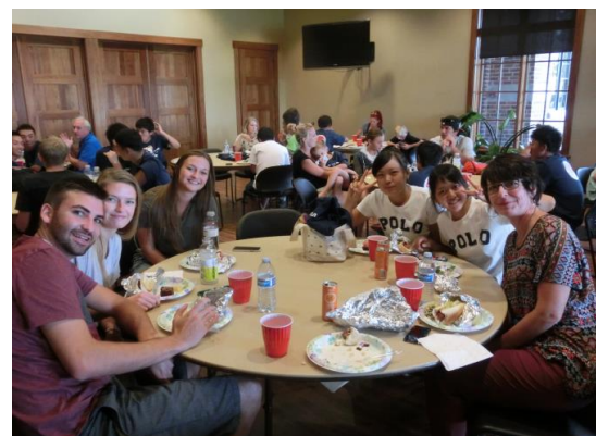
さよならパーティの様子