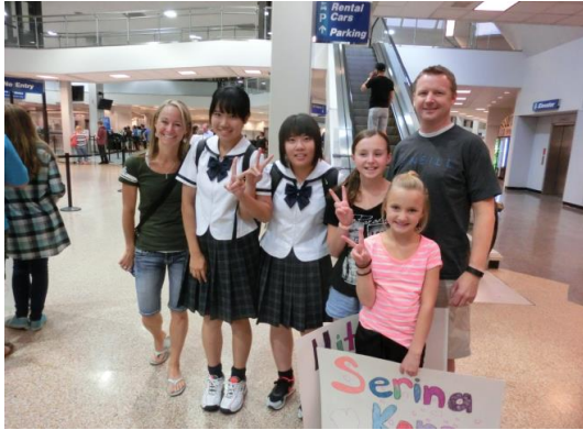
ホストファミリーと対面